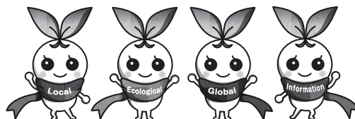
北九州市立大学 公式マスコットキャラクター きたきゅっち