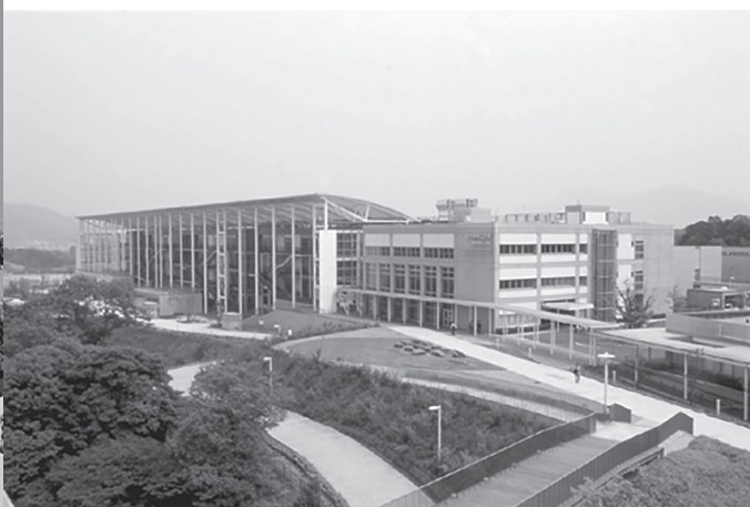
ひびきのキャンパス