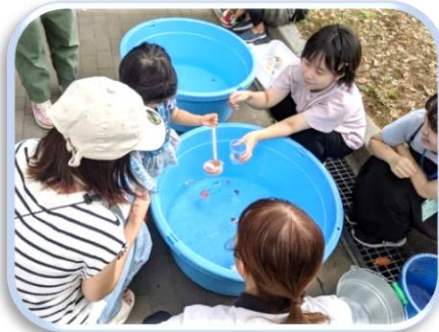
よく工夫されたポイ。すっとつれるので子どもはニコリ！