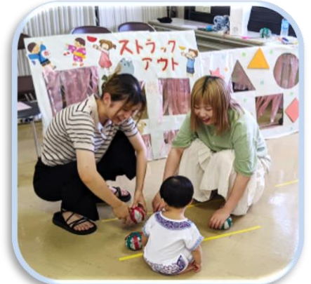
学生と乳幼児が楽しそうに遊ぶ様子は、とてもウレシイ！