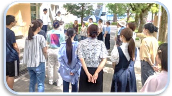
みんなで朝一のミーティング。ちよっとドキドキ、でもワクワク。

全部は紹介できませんが、子どもたちは本当にたのしそうでした！ストラックアウト・もぐらたたき・ボウリング…、他に大人のコーナー「中尾先生の竹の楽器コーナー」「コラボ菜園はっばで遊ぼう」もありましたよ！