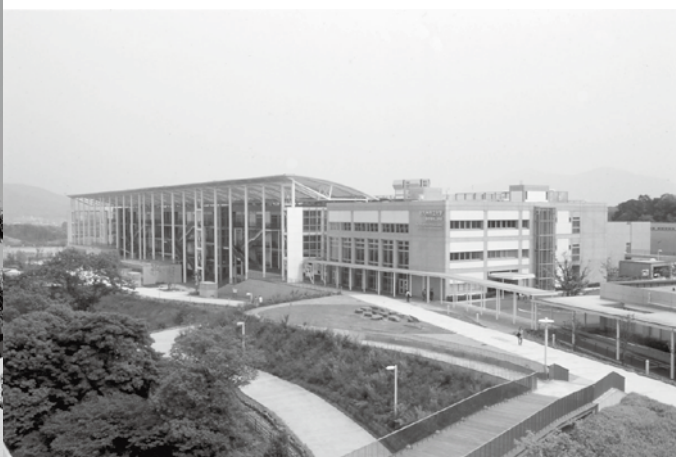
ひびきのキャンパス