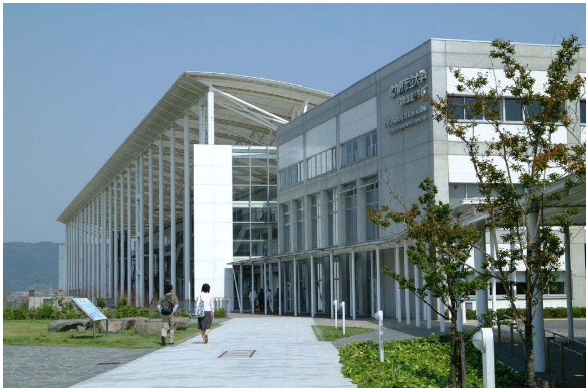
「ひびきのキャンパス」