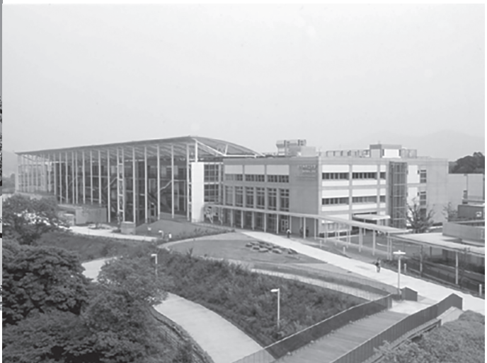
ひびきのキャンパス