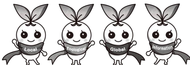
北九州市立大学 公式マスコットキャラクター きたきゅっち

③ 提出書類は返却できませんので、ご了承ください。なお、取得した申込者の個人情報については、採用試験以外の目的で使用することはありません。