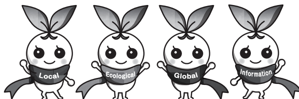
北九州市立大学 公式マスコットキャラクター きたぎゅっち

※受験票は8月25日(月)から印刷可能です。インターネット出願サイトの「申込確認」画面から印刷し、試験当日に持参してください。