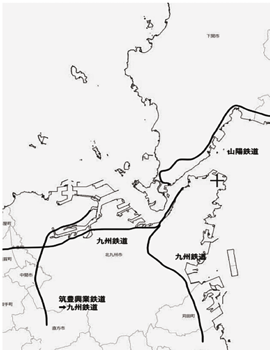
図1、明治期国有化前の鉄道

関門地域の幹線鉄道は九州側において九州鉄道が1891年に大蔵（現八幡東区）・門司（現門司港）間を開通させ、同年、筑豊興業鉄道が直方から折尾を経由して若松まで開通させた。これに続き、1895年九州鉄道が小倉・行事（現行橋）間を開通させた。これに対して本州側では、山陽鉄道が瀬戸内海沿いの路線認可に際し軍部との調整に時間を要して開通が遅れ、1901年になって神戸・馬関（現下関）間全線を開通させた（鉄道省、1921）。1901年の時点における関門地域の鉄道網は図1の通りであり、現在のJR山陽線、JR鹿児島線、JR日豊線、JR筑豊線にあたる関門地域の鉄道網の骨格が形成されたことになる。