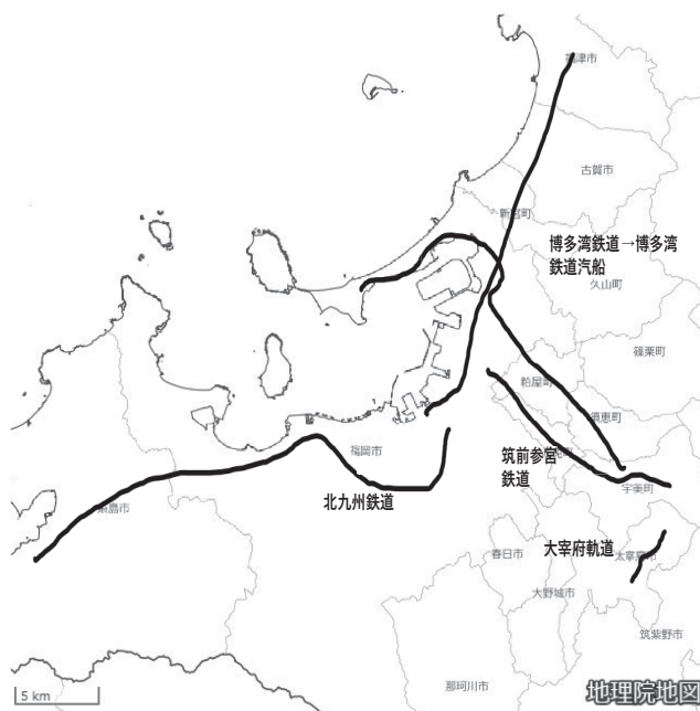
図3 大正・昭和初期の福岡地域の観光客輸送鉄道

また、糟屋炭田の石炭を運搬する鉄道として1904年に博多湾鉄道が須恵・西戸崎間に開通、翌、1905年に須恵・宇美間が延長された。この鉄道は海軍燃料炭を西戸崎において海上積出すものであった。博多湾鉄道はこの石炭輸送に加え、途中の和臼において分岐し、福岡市