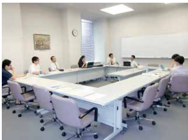
写真⑥ 日中韓の研究会の様子

府不信に関する議論が活発に行われている。特に、財源、人材、組織などの政策資源の配置、政策情報の管理のみならず、予防原則及び危機対応の両方を統合した総合的な政策システムについて議論が深められている。またそれらの一環として情報社会、リスク社会における危機管理、危機管理政策の比較研究も行われている。そこではリスク社会における危機管理の状況、成功事例と成功要因、政策課題などが取り上げられ、危機管理政策の革新についても議論されている。