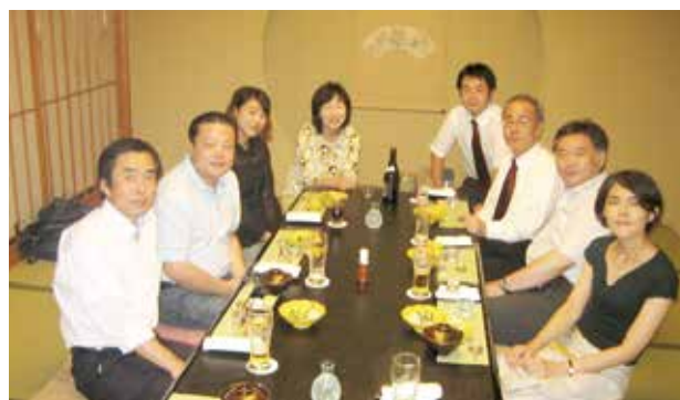
写真⑨ シンポジウム終了後の研究交流会の様子

このように、中国における高齢者をめぐる法・政策は、高齢型社会の進展にあわせて、徐々に整備されてきたと言える。しかし、高齢者扶養に関する各法の条文内容の重複、地方間の格差、社会サービスの着実な実施など、様々な問題も同時に表面化しているのが現状である。