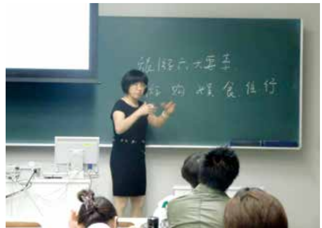
写真① 呉建華教授の講演の様子