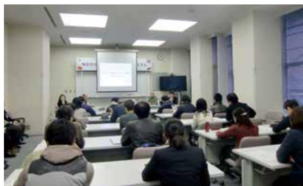
写真④ パネルディスカッションの様子