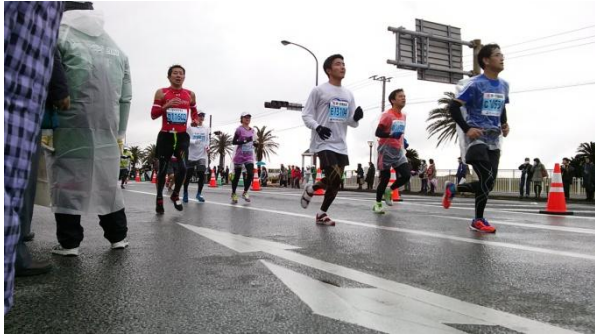
一生懸命走るランナー

今回の北九州マランの完走率は九〇パーセントを超えたそうです。マランに参加した方も、ボランティアとして協力した方も皆さん生き生きとしていて、北九州市全体が元気になったように感じました。