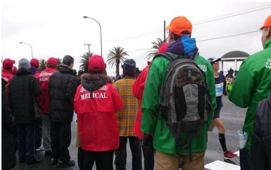
ランナーを支えるスタッフ